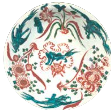
盘 中国，漳州，16或17世纪 瓷，直径38厘米

16及17世纪时期，位于福建省的漳州窑大量生产销往日本及东南亚的瓷器。长久以来，一些国外学者认为漳州瓷是从汕头（广东）的港口输出，因此将这些瓷器称作“Swatow ware”（汕头器）。近期的考古发掘显示这类瓷器其实是在漳州一带的窑口烧制的。