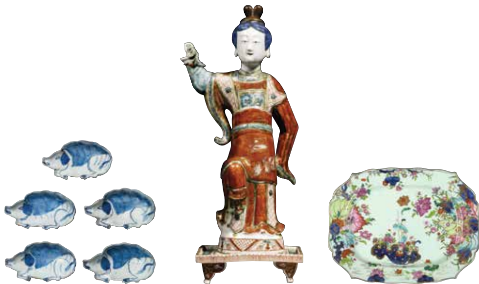
猪形盘一套 中国，景德镇，1620年代 瓷，各宽9.5厘米

17世纪伊始，明朝国力式微，御用瓷器的订单也因而削减。中国制瓷业必须另辟门路，以应对国内需求的萎缩。