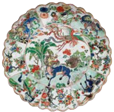
盘：麒麟 中国，约1700年 瓷，直径28.2厘米

中国瓷器风靡全球，视若珍宝，使得欧洲也致力于开创当地的制瓷业。意大利、法国以及英国，先后创烧了较低温的软质瓷。但所谓的“真瓷”，也就是高温硬质瓷，到了1708年德国的梅森才成功烧制。下图的英国软质瓷盘的纹样仿绘了当时流行的中国图案。