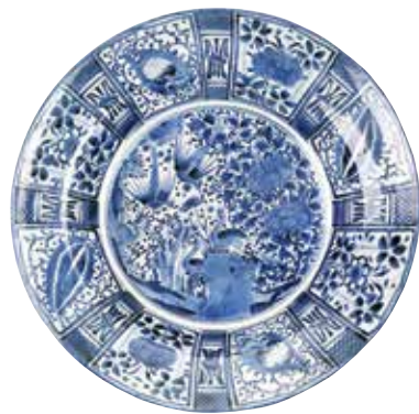
盘 日本，有田，约1700年 瓷，直径54.5厘米

中国瓷器风靡全球，视若珍宝，使得欧洲也致力于开创当地的制瓷业。意大利、法国以及英国，先后创烧了较低温的软质瓷。但所谓的“真瓷”，也就是高温硬质瓷，到了1708年德国的梅森才成功烧制。下图的英国软质瓷盘的纹样仿绘了当时流行的中国图案。