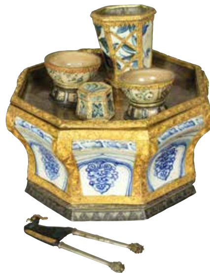
槟榔盒一套 瓷：越南，16或17世纪 鎏金银扣及座架：望加锡（印尼），19世纪。宽34厘米

鎏金银饰将几件越南瓷器组装起来，使之成为一套精美的盒子，盛放嚼槟榔时所需的原料。