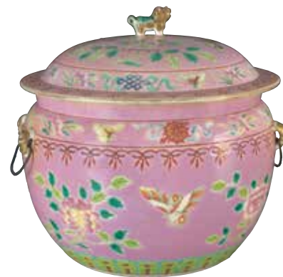
盖盅 中国，景德镇，19世纪晚期或20世纪早期 瓷，高20.1厘米

爪哇及苏门答腊的人民有共用餐具进餐的习惯，因此这类大盘特别受他们的欢迎。许多漳州窑的盘子以阿拉伯文为装饰，显示它们是专为东南亚和中东的伊斯兰市场烧制的。