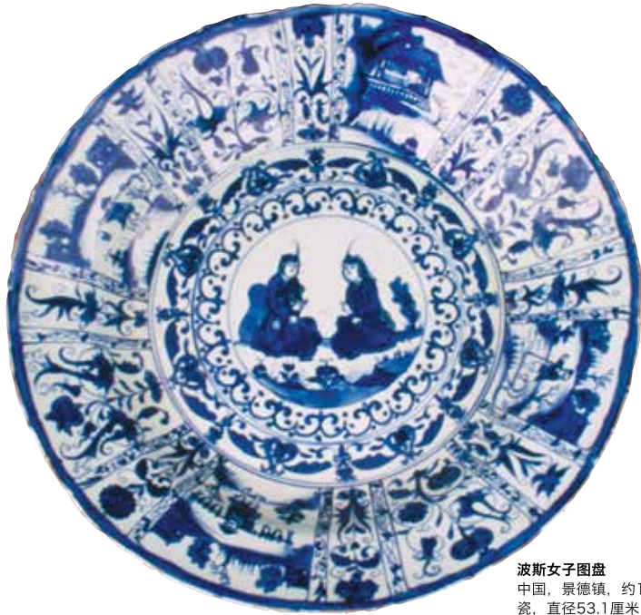
波斯女子图盘 中国，景德镇，约1580-1644年（明代） 瓷，直径53.1厘米

威尼斯旅人马可·波罗（1254—1324年）来到中国后，在忽必烈的宫廷首次目睹瓷器的制作过程。他称之为“porcellana”，意大利语意指一种白色的贝壳。这个代表瓷器的词汇很快便在欧洲通行起来。