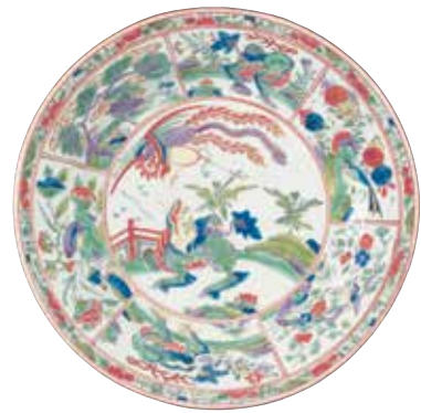
盘：麒麟 英国，伍斯特，1770年代 软质瓷，直径22.2厘米 江川淑夫（Toshio Egawa）夫妇捐赠