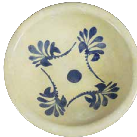
棕榈叶纹碗 阿拔斯王朝（伊拉克），9世纪 陶，釉下钴蓝彩，直径24.6厘米

在阿拔斯王朝（750—1258年）统治期间，阿拉伯和波斯陶匠开始烧造设计精致的锡白釉陶器。这些受中国瓷器影响的西亚陶器，一推出市场即获得商业性的成功。