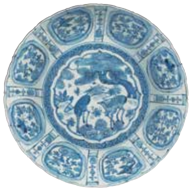
盘 中国，景德镇，17世纪 瓷，直径35厘米

中国瓷业一度受政局影响而停顿，荷兰商人于是积极寻找替代品，从而转向日本。日本烧制的亮丽彩瓷极受欢迎，中国恢复出口贸易后，陶匠也开始模仿日本瓷器的风格。