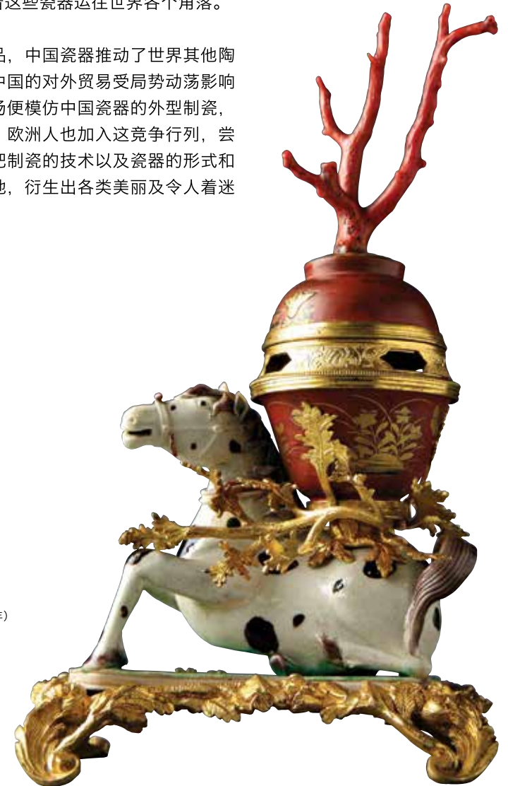
香炉 于欧洲组装，18世纪 瓷马：中国，清康熙（1662-1722年） 漆杯：日本，17世纪 鎏金铜：法国，约1750年 高25厘米

如同一般备受欢迎的商品，中国瓷器推动了世界其他陶瓷业的竞争性生产。当中国的对外贸易受局势动荡影响时，东南亚和日本的窑场便模仿中国瓷器的外型制瓷，以填补陶瓷市场的缺口。欧洲人也加入这竞争行列，尝试烧造瓷器。国际贸易把制瓷的技术以及瓷器的形式和艺术风格散播到世界各地，衍生出各类美丽及令人着迷的成品。