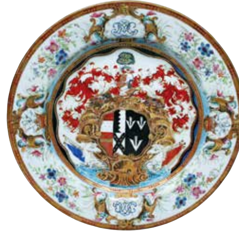
纹章盘 中国，约1783年 瓷，直径23厘米