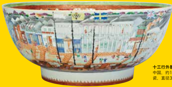
十三行外景图碗 中国，约1785年 瓷，直径36厘米

中国瓷匠为外来的商人烧制这类瓷碗，作为他们远赴中国经商的精致纪念品。这种碗主要描绘广州海滨繁忙的洋行，即外商办事处和居所。