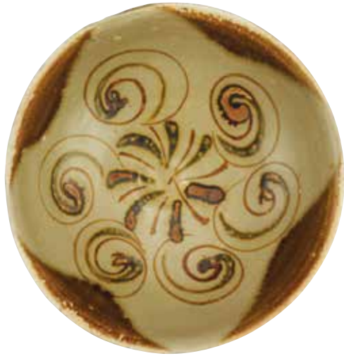
碗 中国，约830年 炆器，直径15.2厘米 唐代沉船，勿里洞岛

陶瓷因其重量及防水性质，被装载在货船的最下层以压稳船舱。许多船只在海上不幸遭遇船难，就算过了千百年，这些深沉在大海中的陶瓷也保存得相对完好。