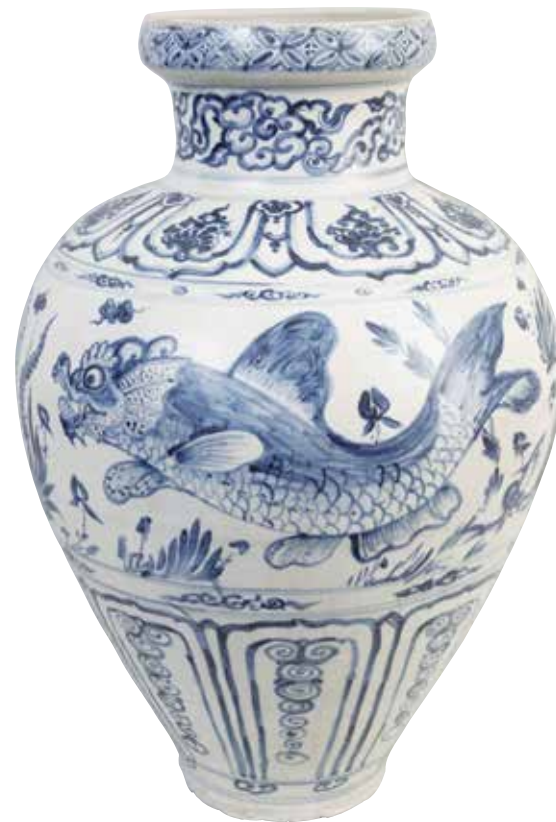
罐 越南北部，15世纪 炆器，89厘米

明朝洪武皇帝朱元璋（1368—98年）实施海禁，禁止对外贸易，导致瓷器出口数量骤降。泰国和越南的窑场于是提高生产能力，迅速地填补中国瓷器的短缺。越南北部的陶匠在炆器表面施上一层白色化妆土（以粘土和水混合而成），以求仿效中国瓷器的外观及颜色。在此期间，大量的越南瓷外销至菲律宾、爪哇、苏拉威西、马来半岛，甚至日本和土耳其。