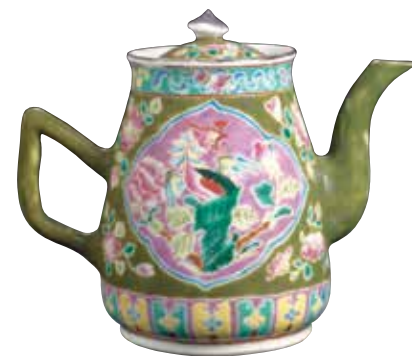
咖啡壶 中国，20世纪早期 瓷，15.3x 18.5厘米