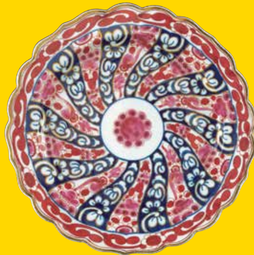
盘 英国，伍斯特，约1765-75年 软质瓷 江川淑夫 (Toshio Egawa) 夫妇捐赠